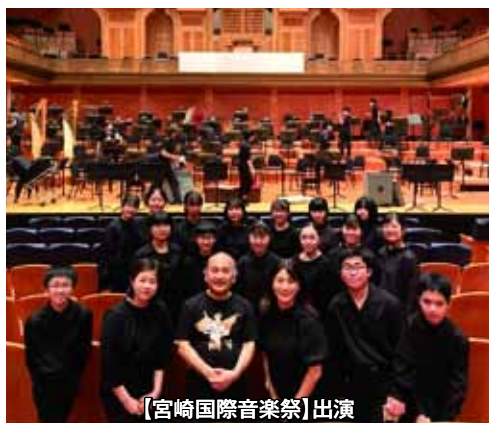
【宮崎国際音楽祭】出演