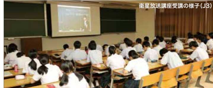
衛星放送講座受講の様子(J3)

本校スタッフの洗練された授業に加え、朝夕の課外授業そして大手予備校の代々木ゼミナール(サテライン)、河合塾(サテライト)の衛星講座も取り入れています。教室で一斉に自分のペースで受講することができます。高校生のカリキュラム(数学・英語・理科)を、既に履修している鵬翔中3年生も予習や復習に活用します。