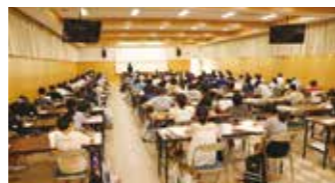
特待生チャレンジテストの様子