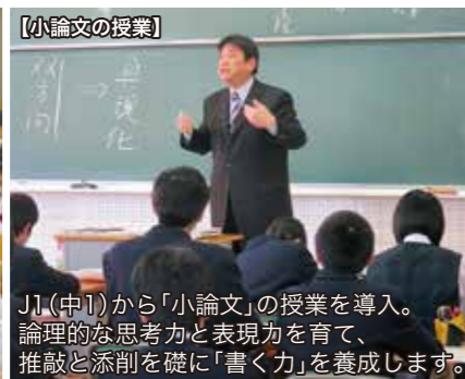
J1(中1)から「小論文」の授業を導入。論理的な思考力と表現力を育て、推敲と添削を礎に「書く力」を養成します。

【医歯薬系統】 【東大・京大・阪大・九大対策】 ※[理科3科目/地歴2科目] 通常授業内で完全対応