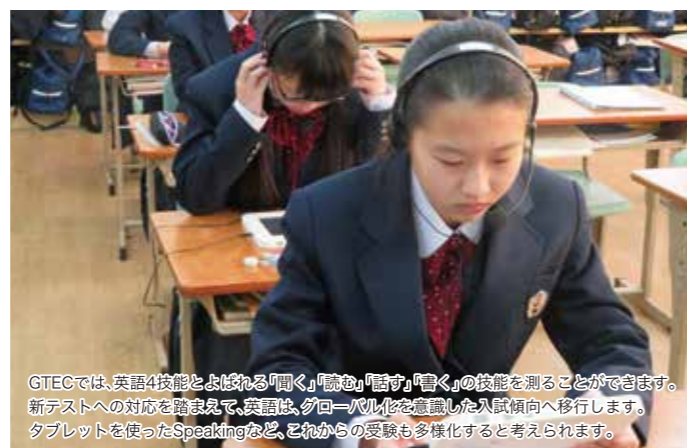
GTECでは、英語4技能とよばれる「聞く」「読む」「話す」「書く」の技能を測ることができます。新テストへの対応を踏まえて、英語は、グローバル化を意識した入試傾向へ移行します。タブレットを使ったSpeakingなど、これからの受験も多様化すると考えられます。

対外模試や各種検定にも的確な対応で積極的に挑戦!! 全学年、年に3回の対外全国模試(ベネッセ中高一貫模試)、12月には「GTEC for Student」を受験します。実用英語技能検定・漢字検定・数学検定などの対策も行い、その合格率は確実に上昇傾向です。時間を十分かけて、対策授業・個別指導を展開しています。