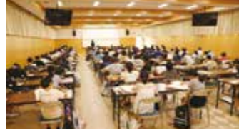
特待生チャレンジテストの様子