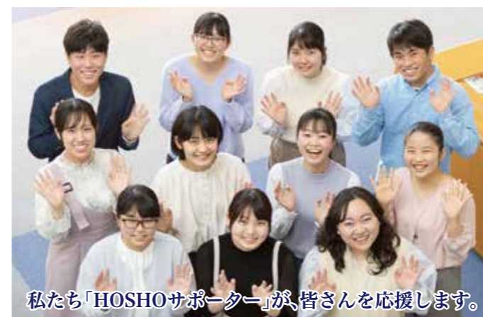
私たち「HOSHOサポーター」が、皆さんを応援します。

私たち、鵬翔中学校(中高一貫)特進英数科のOB・OG(現役国公立大学生・大学院生)が、皆さんの日々の勉強を応援します。毎日の「放課後学習(17:00~19:00)」に先輩たちも参加します。君たちからの質問、疑問を待っています。日々の勉強の方法についても、ていねいに教えます。遠慮なく相談してくださいね。数学・理科・英語の個別指導も安心してまかせてください。皆さんの入学を待っています。