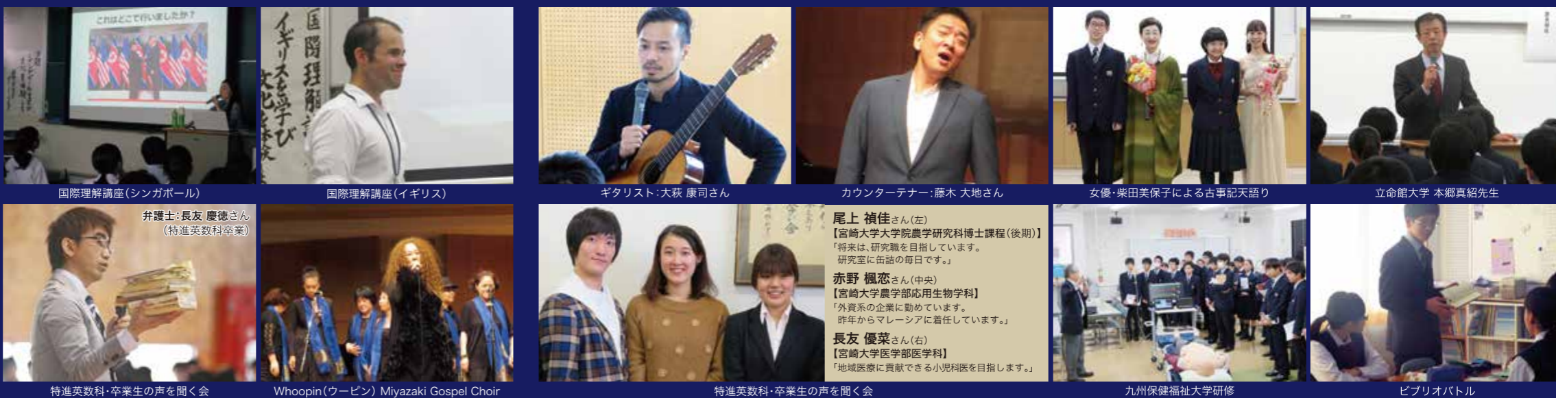
国際理解講座(シンガポール)

インターンシップ、APU研修、進学講演会、NIE活動、立志式、外務省講座、県議会・裁判所見学、大学出前講座、リスニングトレーニング(GTEC対策)、保健講話、卒業生講話、地域清掃活動、異文化理解講座、テーマ学習、小論文講座、企業人講座、ものづくり講座、ジュニア・ロースクール、中学課程修了論文作成、大淀川水辺調査、古武道講座、ピブリオバトル(読書旬間)、九州大学・熊本大学研修等