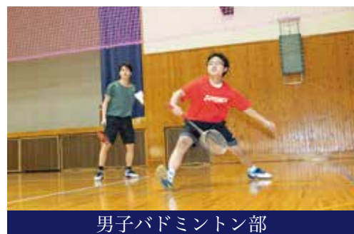
男子バドミントン部