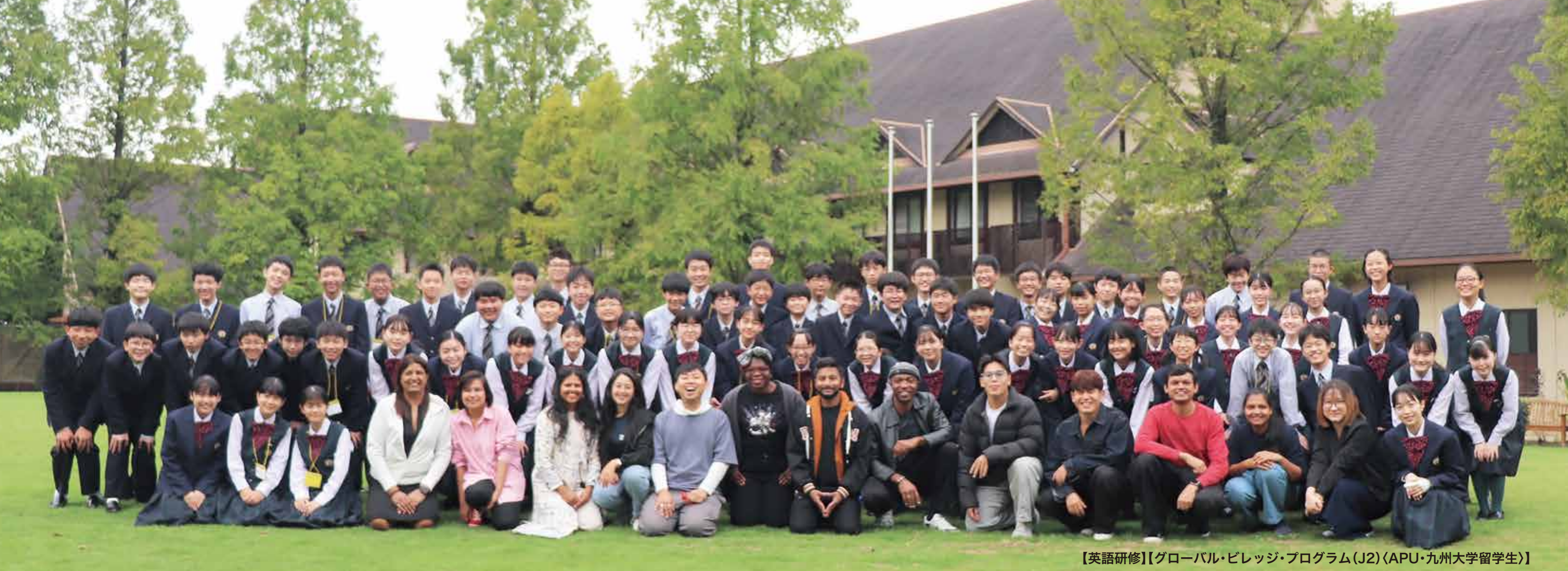
【英語研修】【グローバル・ビレッジ・プログラム(J2)〈APU・九州大学留学生〉】

これから始まる鵬翔での中学校生活。君たちの可能性は計り知れないものです。 夢にむかって翔びだすためには、学ぶ姿勢を身につけながら、 どんなことにも前向きに取り組むことが必要となります。 鵬翔中学校は、6年後の君に笑顔届ける学校づくりをしています。 中高一貫教育、少人数指導、プレカレッジ講座など充実したカリキュラムにより、 個人の能力を引き出し、そして高める指導を可能にしています。 叶えたい夢を実現する場所、それが 学校法人 大淀学園 鵬翔中学校 です。