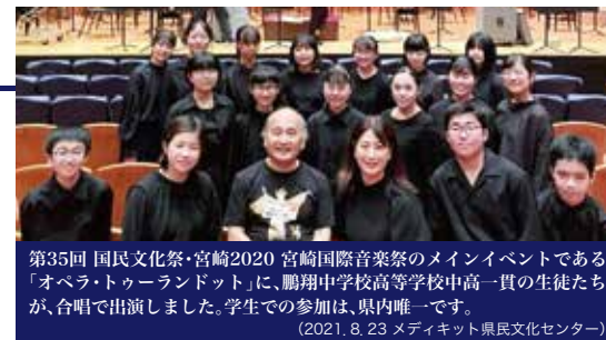
第35回 国民文化祭・宮崎2020 宮崎国際音楽祭のメインイベントである「オペラ・トゥーランドット」に、鵬翔中学校高等学校中高一貫の生徒たちが、合唱で出演しました。学生での参加は、県内唯一です。 (2021. 8. 23 メディキット県民文化センター)