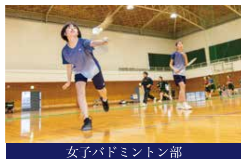
女子バドミントン部