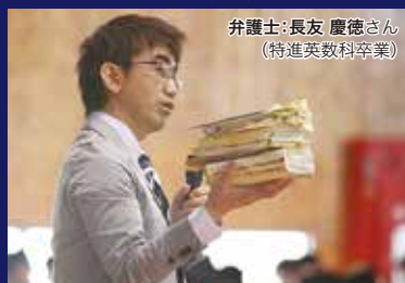
特進英数科・卒業生の声を聞く会