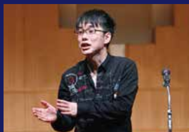
ゴスペラーズ:北山 陽一さん