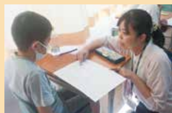
鵬翔サマースクール

9月 September ●始業式 ●夏期課題定着テスト ●地域調査研究発表 ●英語弁論大会 ●文化発表会 ●体育大会