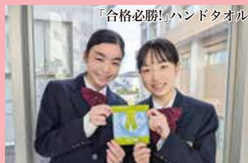
大学入学共通テスト激励会

2月 February ●入学試験(後期) ●第5回定期考査 ●ビブリオバトル(読書旬間) ●入学準備セミナー(来春入学の小学6年生) ●立志式(2年次) ●プレカレッジ講座