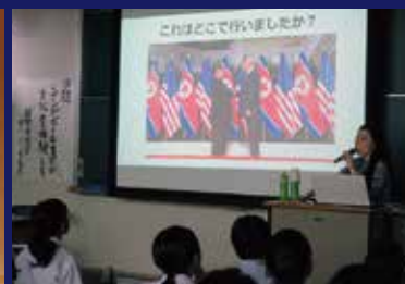
国際理解講座(シンガポール)