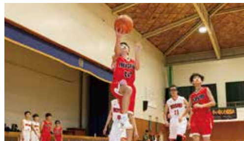
男子バスケットボール部

◎中学・高校合同部活動…吹奏楽部・インターアクト部・ロボット部・柔道部・水泳部・新体操部