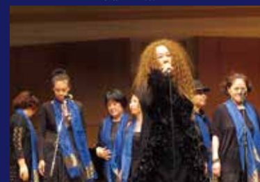
Whoopin(ウーピン) Miyazaki Gospel Choir