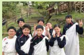
新入生宿泊研修(キャンプファイヤー)

5月 May ●創立記念行事 ●プレカレッジ講座 ●「早朝課外」スタート ●国際理解講座 ●「HOSHOサポート」スタート ●第1回定期考査