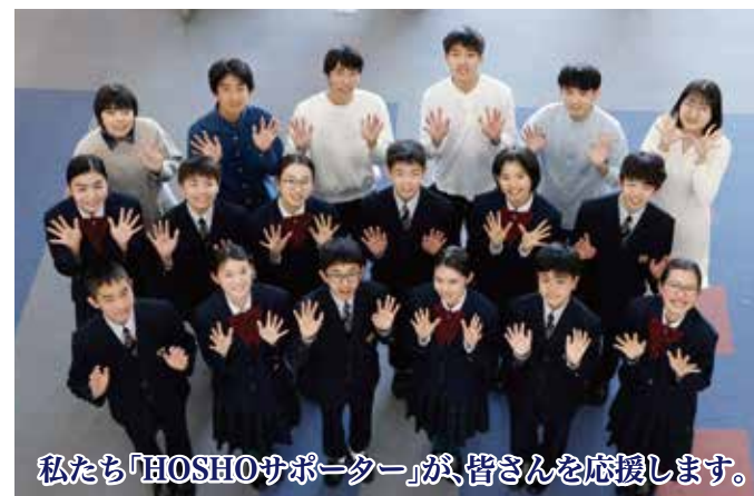
私たち「HOSHOサポーター」が、皆さんを応援します。

私たち、鵬翔中学校(中高一貫)特進英数科のOB・OG(現役国公立大学生・大学院生)が、皆さんの日々の勉強を応援します。毎日の「 放課後学習(17:00~19:00) 」に先輩たちも参加します。君たちからの質問、疑問を待っています。日々の勉強の方法についても、ていねいに教えます。遠慮なく相談してくださいね。数学・理科・英語の個別指導も安心してまかせてください。皆さんの入学を待っています。