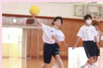
ファミリーマッチ