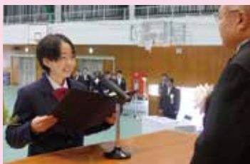
中学校課程修了証書授与式

3月 March ●修学旅行(3年次) ●修了式 ●中学校課程修了証書授与式 ●春期課外授業 ●ファミリーマッチ ●進路講演会 ●学年末総復習テスト