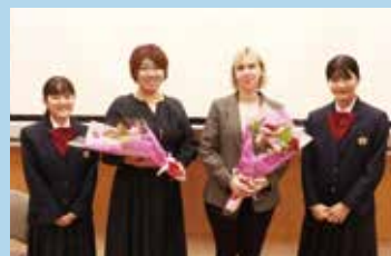
プレカレッジ講座(EU特別講座)

3月 March ●修学旅行(3年次) ●修了式 ●中学校課程修了証書授与式 ●春期課外授業 ●ファミリーマッチ ●進路講演会 ●学年末総復習テスト