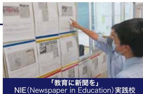
「教育に新聞を」 NIE (Newspaper in Education) 実践校

鵬翔中学校は、生徒達に経験を通して成長してほしいと考えています。 学校行事での経験は、夢を見つけるきっかけになるかもしれません。 そして仲間とつくる思い出は一生の宝物となります。