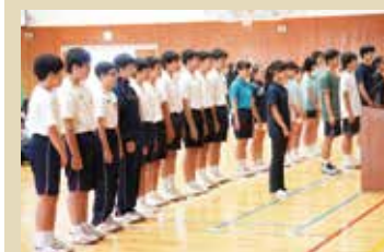
中体連秋季大会壮行式

10月 October ●中体連秋季大会 ●中学校駅伝大会 ●生徒会選挙 ●ベネッセ中高一貫模試 ●第3回定期考査 ●高1対象:ベネッセ進研模試(J3) ●生徒会新旧交代式