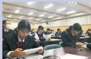
GTEC for Student

1月 January ●始業式 ●国際交流会 ●成人式(中高一貫) ●法教育授業 ●入学試験(前期) ●大学入学共通テスト激励会 ●冬期課題定着テスト ●ベネッセ中高一貫模試