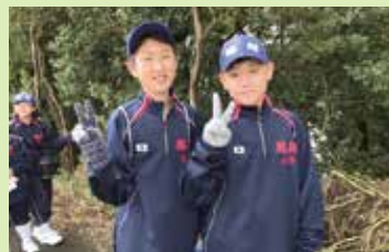
新入生宿泊研修(強歩会)

4月 April ●入学式 ●新入生宿泊研修 ●春期課題定着テスト ●強歩会(2・3年次) ●対面式 ●放課後学習スタート ●部活動紹介 ●ベネッセ中高一貫模試