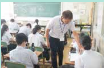
早朝課外スタート

5月 May ●創立記念行事 ●プレカレッジ講座 ●「早朝課外」スタート ●国際理解講座 ●「HOSHOサポート」スタート ●第1回定期考査