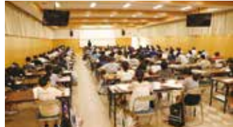
特待生チャレンジテストの様子