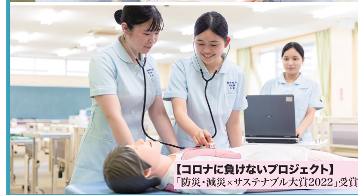
【コロナに負けないプロジェクト】 「防災・減災×サステナブル大賞2022」受賞