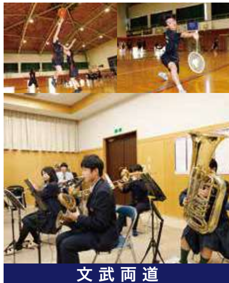
文 武 両 道

●藤元メディカルシステム付属医療専門学校 ●北九州リハビリテーション学院 ●福岡リハビリテーション専門学校 ●日本工学院専門学校 ●熊本医療総合リハビリテーション学院 ●フィオーレKOGA看護専門学校 ●日南看護専門学校 他