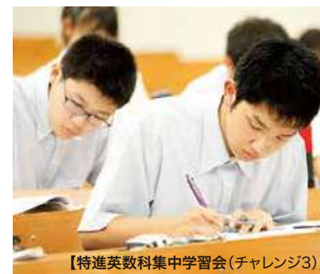
【特進英数科集中学習会(チャレンジ3)】