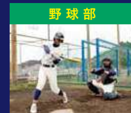
野 球 部