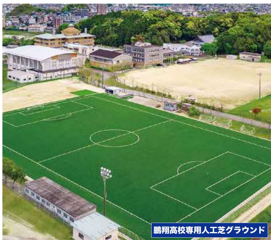
鵬翔高校専用人工芝グラウンド