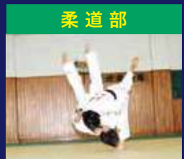
柔 道 部