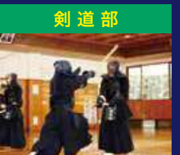
剣 道 部