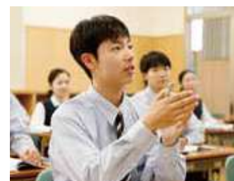
徹底した「習熟度学習」(3年次の一例)