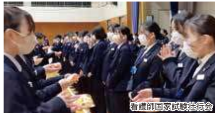
看護師国家試験壮行会