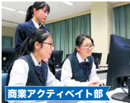
商業アクティビティ部