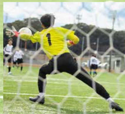
鵬翔高校専用人工芝グラウンド