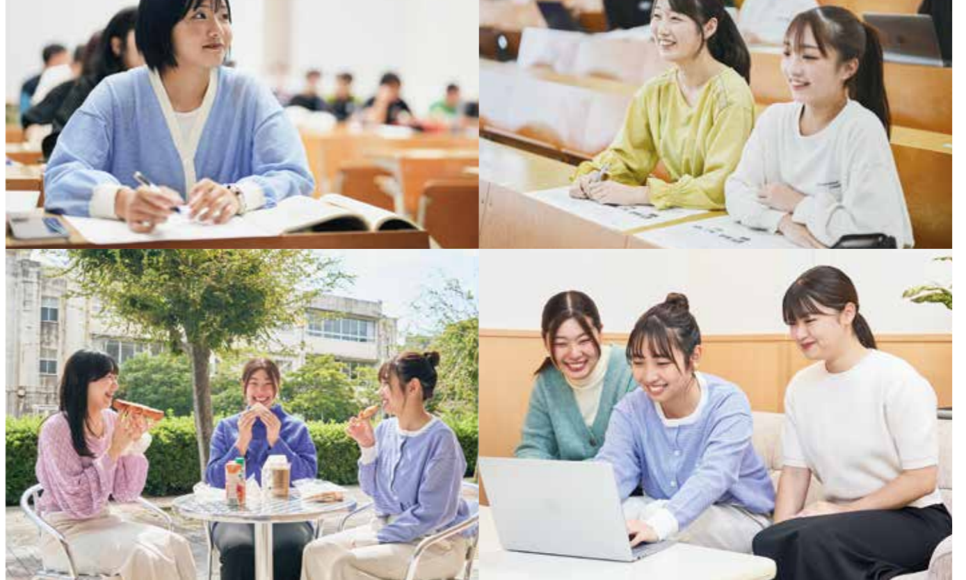
学生会館には、「レディ・サロン」・「パウダールーム」のスペースを備えています。