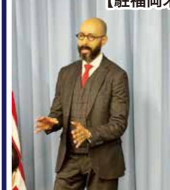
首席領事 Chuka Asike