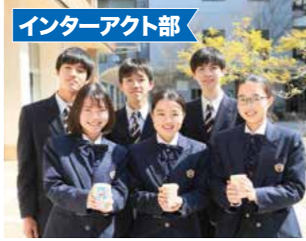
インターアクト部