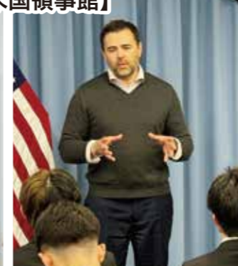
広報担当領事 Strader Payton