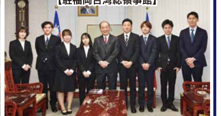
総領事 陳 銘俊 博士